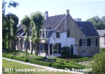
2011 voorgevel boerderij op De Rozenhof