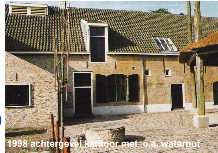
1998 achtergevel kantoor met o.a. waterput