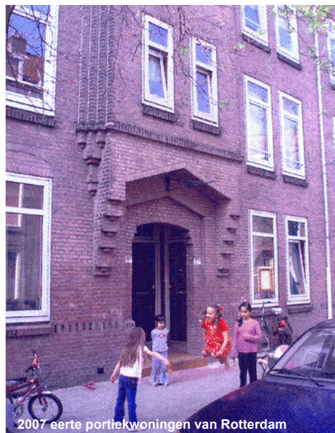
2007 eerte portiekwoningen van Rotterdam