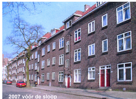
2007 vóór de sloop