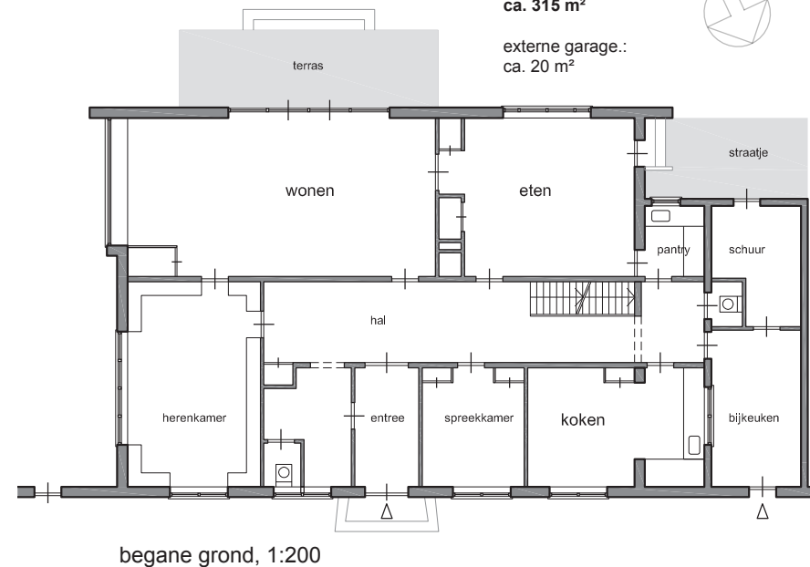
begane grond, 1:200