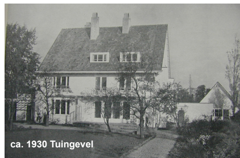
ca. 1930 Tuingevel