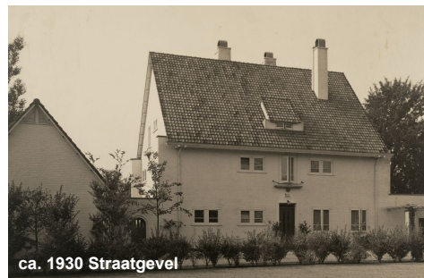
ca. 1930 Straatgevel