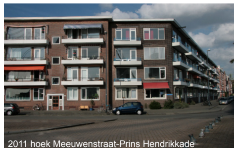
2011 hoek Meeuwenstraat-Prins Hendrikkade

Eigendom: Philips pensioenfonds heeft de appartementen als huurwoningen laten bouwen. In de loop der tijd zijn de appartementen aan de huurders verkocht. Er wonen veel oud-schippers en eerste eigenaar bewoners.