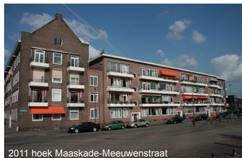
2011 hoek Maaskade-Meeuwenstraat