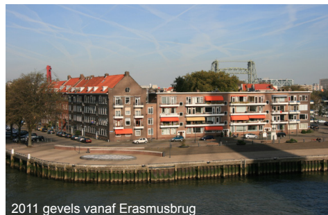
2011 gevels vanaf Erasmusbrug