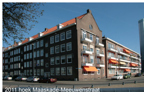
2011 hoek Maaskade-Meeuwenstraat