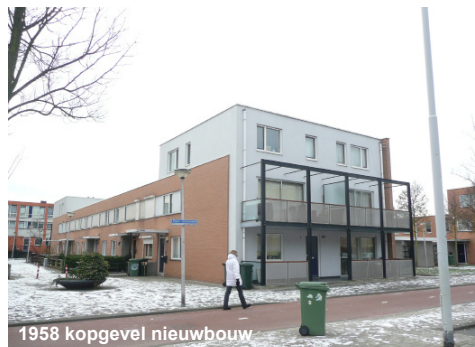
1958 kopgevel nieuwbouw

Renovatie: Op deze locatie langs de Pieter Stastokweg zijn 3 blokken niet gesloopt maar hergebruikt en in het jaar 2000 gerenoveerd. De oorspronkelijke 42 woningen (1 flat op een woning van 2 lagen) zijn omgebouwd tot 28 ruime eengezinswoningen. Dit kon gebeuren (zie schema) door de laag bovenwoningen per kavel bij de ondergelegen woningen te voegen. De woningen zijn na oplevering verkocht aan particuliere eigenaren.