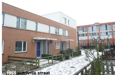
1965 autovrije straat