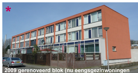
2009 gerenoveerd blok (nu eengezinwoningen)