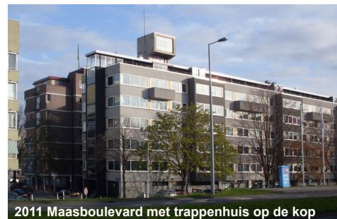
2011 Maasboulevard met trappenhuis op de kop