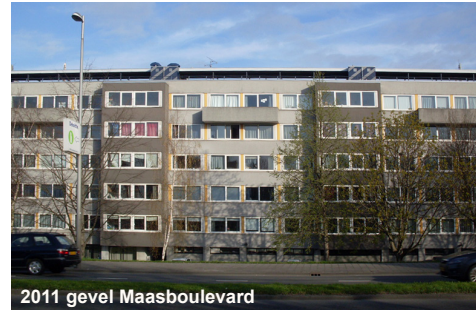
2011 gevel Maasboulevard