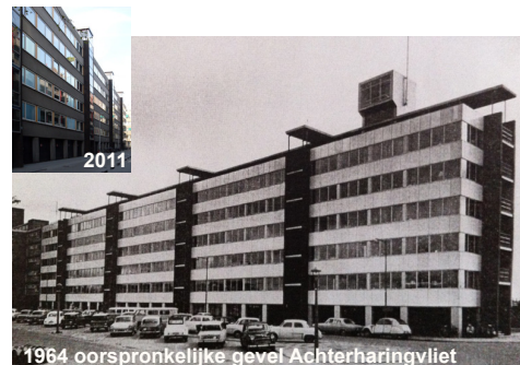
1964 oorspronkelijke gevel Achterharingvliet

Bouwgiedenis: Met de vestiging van de Economische Hogeschool (nu Erasmus Universiteit) aan de oostzijde van Rotterdam heeft de lange, smalle locatie (88x10m) parallel aan en enkele tientallen meters van het Haringvliet de bestemming studentenhuisvesting gekregen. Voor studenten een uitermate geschikte locatie, nabij het centrum met voorzieningen en openbaar vervoer. In de plint is een rijwielstalling en bedrijfsruimte opgenomen; op de vijfde verdieping bevonden zich twee eenheden van elf kamers voor vrouwelijke economiestudenten; enkele verblijven voor gastdocenten en/of gaststudenten en een beheerderswoning. Toen de bouw gereed was werden alle kamers verhuurd met vaste inrichting: een garderobekast, een bed met matras en schrijftafel met stoel.