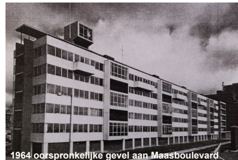
1964 oorspronkelijke gevel aan Maasboulevard