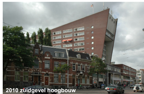
2010 zuidgevel hoogbouw