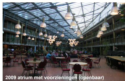
2009 atrium met voorzieningen (openbaar)