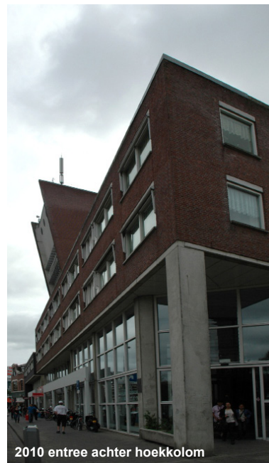
2010 entree achter hoekkolom