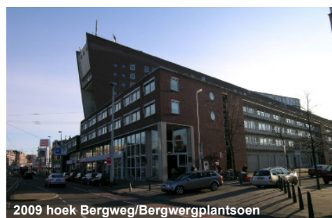
2009 hoek Bergweg/Bergwegplantsoen

Constructie: Het complex is gebouwd met gewapend betonnen wanden, kolommen en vloeren; de gevels zijn grotendeels van baksteen. Het dak van het atrium is een lichte staalconstructie.