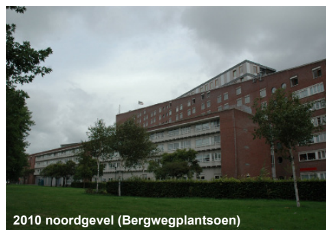
2010 noordgevel (Bergwegplantsoen)