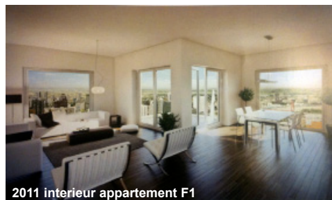
2011 interieur appartement F1

Aantal kamers, oppervlakte: 84m 2 t/m 212 m 2 . Een standaard verdieping (11 t/m 38) bevat woningen met drie, vier of vijf kamers met een woonoppervlakte van 87m 2 tot 135m 2 en een loggia. De vrije hoogte is met 2,95 m uitzonderlijk. In „The Crown“ zijn maisonnettes met meerdere balkons.