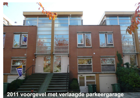
2011 voorgevel met verlaagde parkeergarage